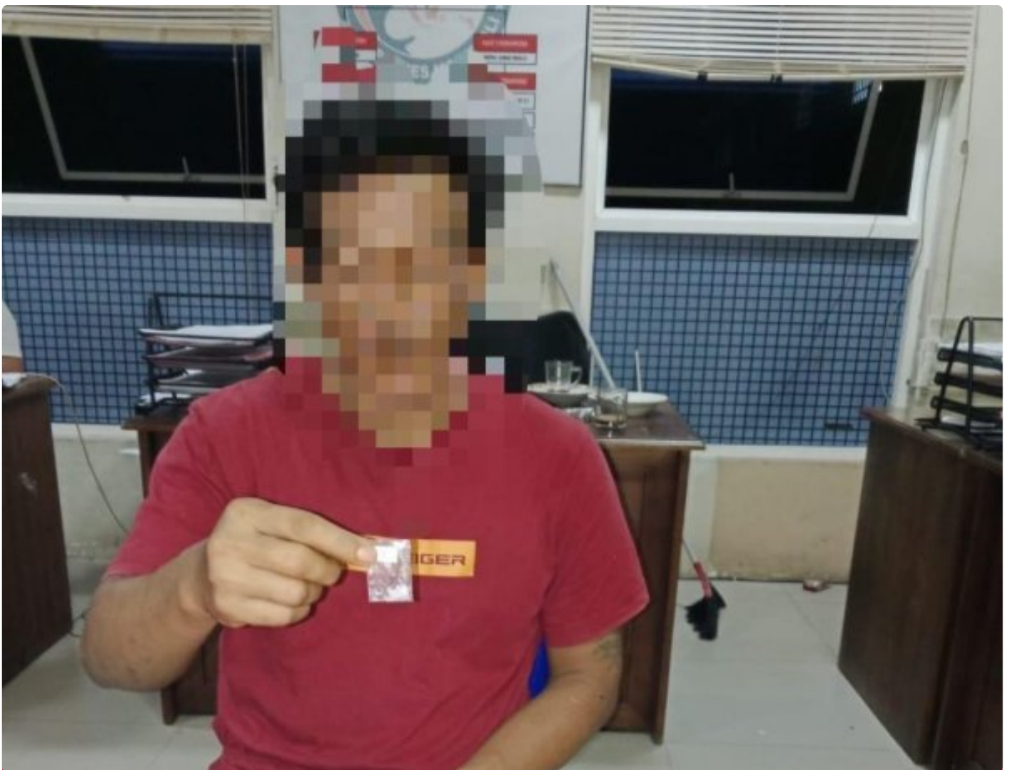
Pelaku terlibat Sabu terancam penjara seumur hidup

Morowali, 15 Januari 2025 – Polres Morowali berhasil mengungkap