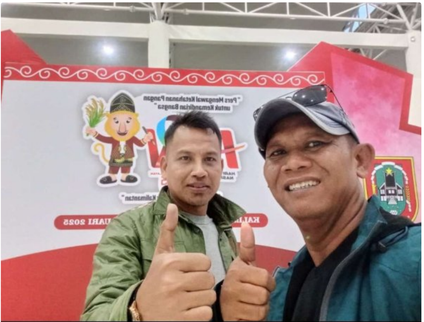
Sekretaris dan Bendahara PWI Kabupaten Morowali

MOROWALI, Sulawesi Tengah- Pengurus Persatuan Wartawan Indonesia (PWI) Kabupaten Morowali, Sulawesi Tengah menyatakan siap mengikuti puncak peringatan Hari Pers Nasional (HPN) di Banjarmasin, Kalimantan Selatan.